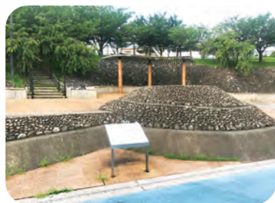
▲光正寺古墳は、全長54メートル。

古代の「不弥国王」のお墓！ とも言われる光正寺古墳。西暦2000年代後半に作られた。歴史の墓とあり、糟屋平野の前方後円墳であり、糟屋平野の前方後円墳として整備されています。史跡公園として整頓されています。そのお散歩やウォーキングを楽しむ場所です。