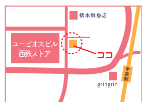
住所：糟屋郡宇美町宇美4-9-10

折り紙に関しては、宇美町の学童保育でも教えられているほどのプロ。様々な動物の折り紙は心癒されます。