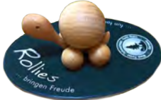
▲ヨーロッパ製のカメのおもちゃ。足がコロコロと回り、背中の丸い部分がそれに合わせてコロコロと回ります♪