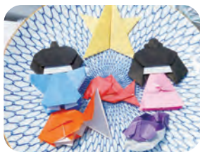
▲刺身皿にのった、店長の作った折り紙たち♪