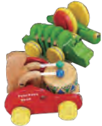
▲おもちゃの「プルトイ (pull-toy)」。