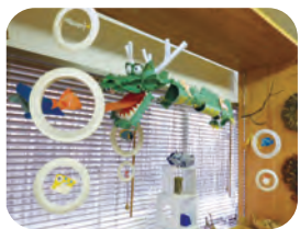
▲紙工作や折り紙がたくさん！